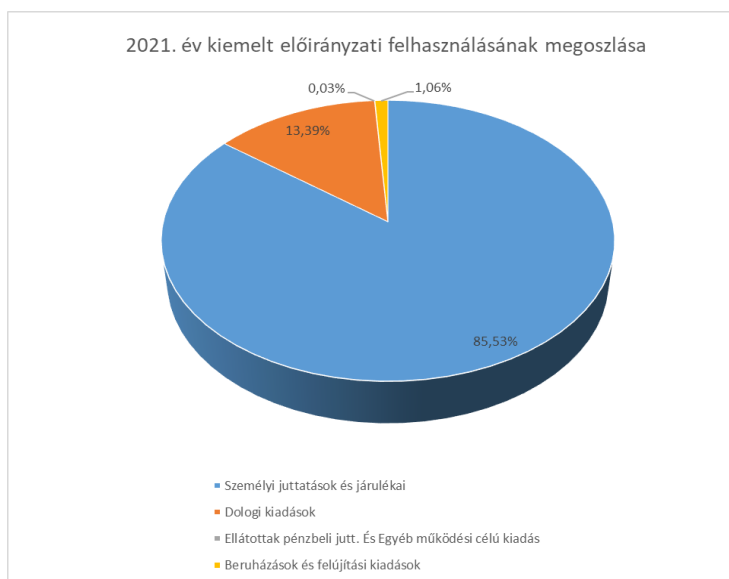
2. sz. ábra: A 2021. évi kiemelt előirányzat felhasználásának megoszlása

A Kar 2021. évben összes kiadása 4.003.578.816 Ft volt. A Kar kiadásainak 85,53%-át a személyi juttatások és járulékai tették ki. A dologi kiadások 13,39%-ot, a beruházási és felújítási kiadások közel 1,06 %-ot tettek ki, hallgatói juttatásokra pedig további 0,03 %-ot fordított a BTK.